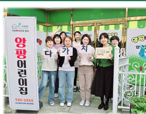
(민간형) 양팡 어린이집