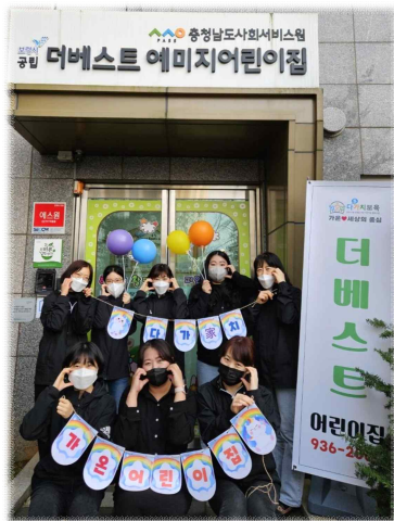
(국공립형) 더베스트에미지 어린이집

2024년 다(多)가치 보육 참여 어린이집 모두가 「아이들 중심 보육」으로 참여하겠다는 다짐을 가졌어요!