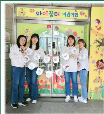
(가정형) 리틀아이꿈터 어린이집

다(多)가치 보육 참여 [가온] 어린이집으로 2024년 「함께 동행하기」 챌린지 다짐!