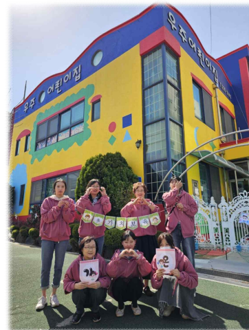
(민간형) 우주 어린이집