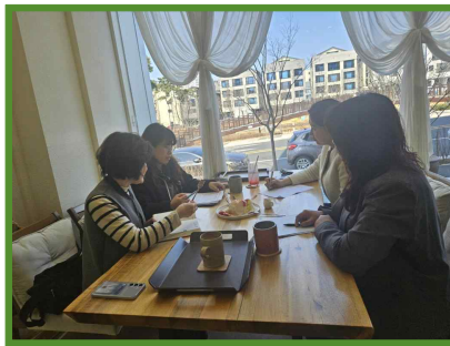
2024.3월 원장님들의 다(多)가치 보육 실행 계획 실무협의회 (3.6/3.18)