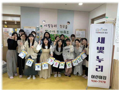
(직장형) 새빛누리 어린이집

2024년 다(多)가치 보육 참여 어린이집 모두가 「아이들 중심 보육」으로 참여하겠다는 다짐을 가졌어요!